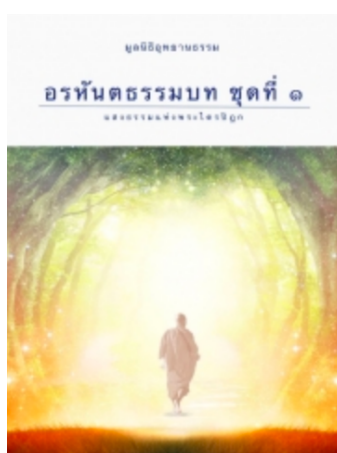
อรหันตธรรมบท ชุดที่ ๑