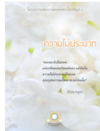
ความไม่ประมาท