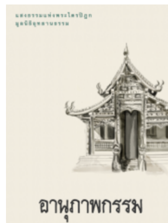
ฉานุภาพกรรม