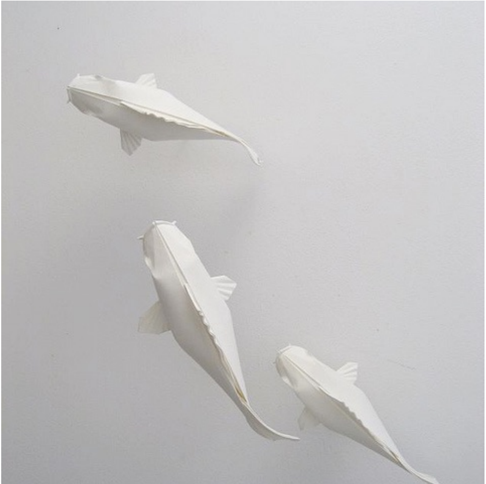
Title : White origami koi pond