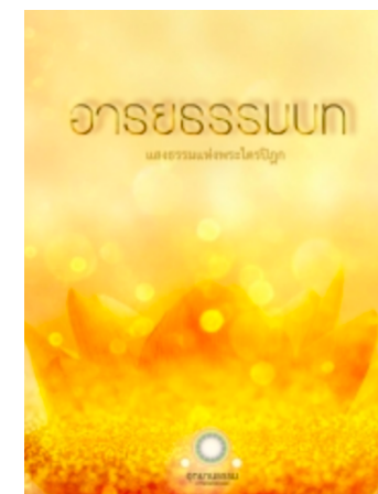
อารยธรรมบท ชุดที่ ๑