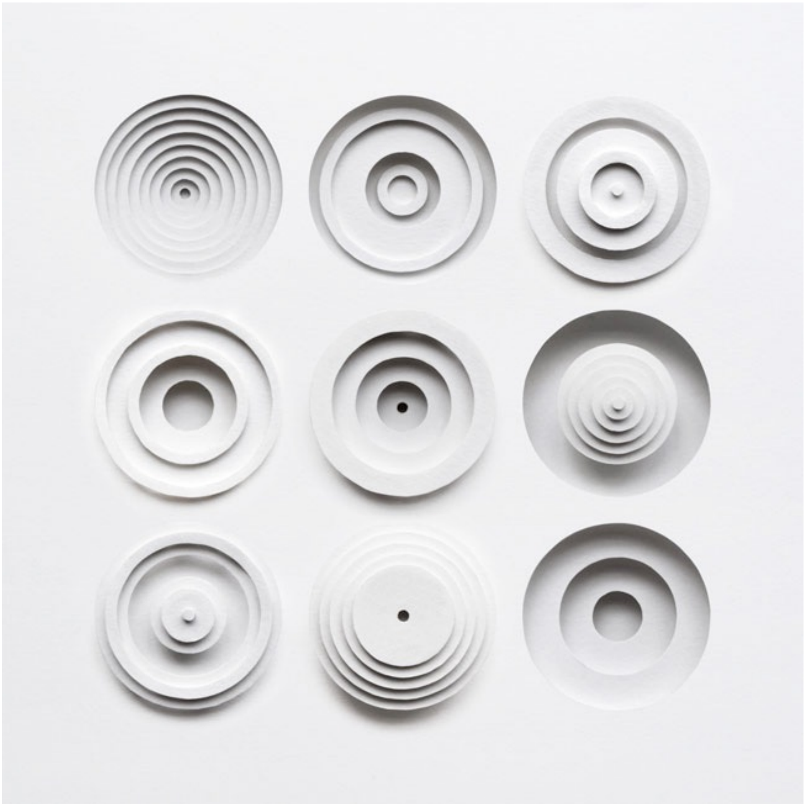
Paper Illustration & Sculpture Artist : Owen Gildersleeve