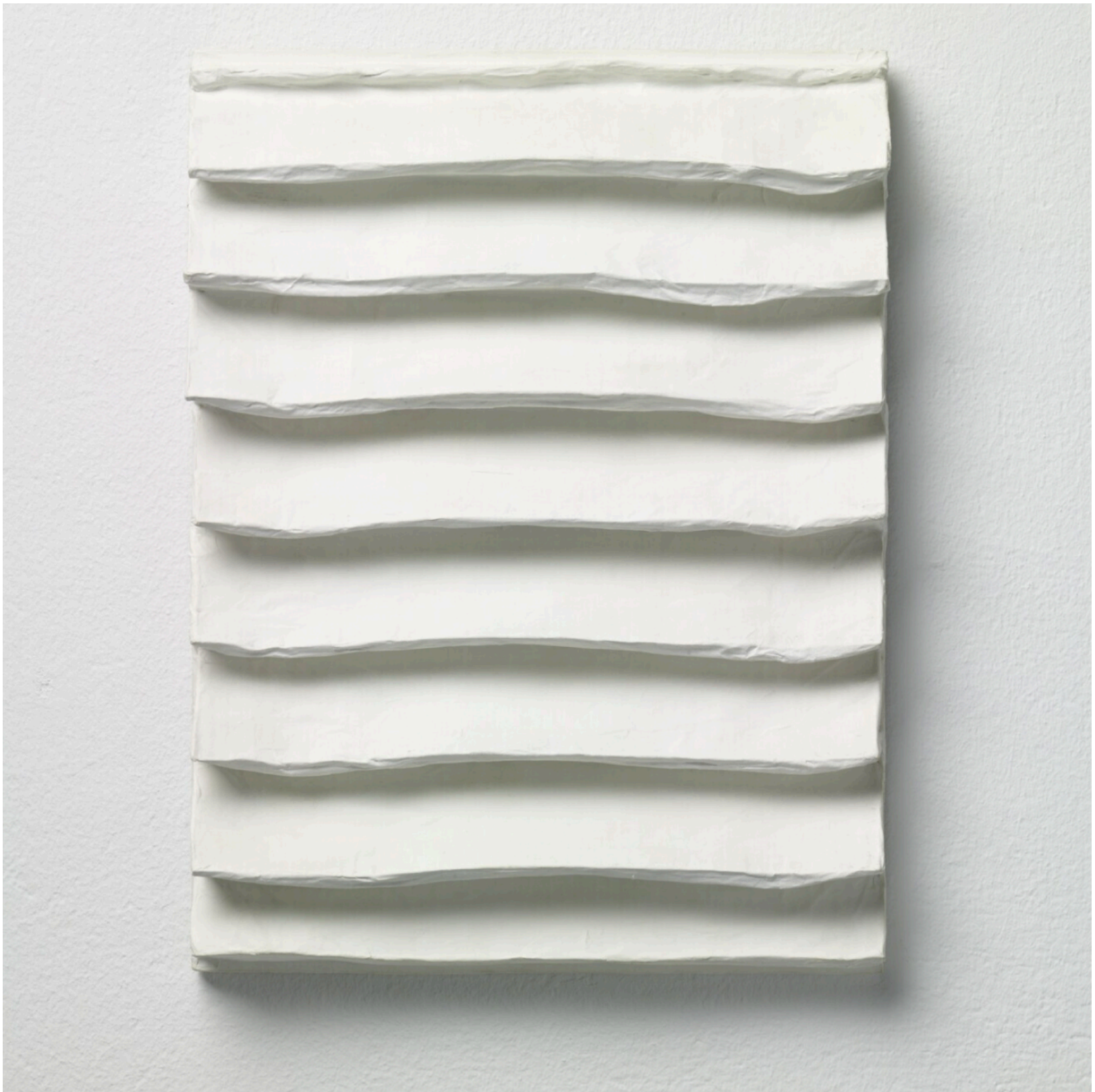
Title : R 81-5 Artist : Jon Schoonhoven