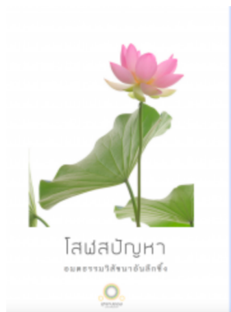
โสฬสปัญญา