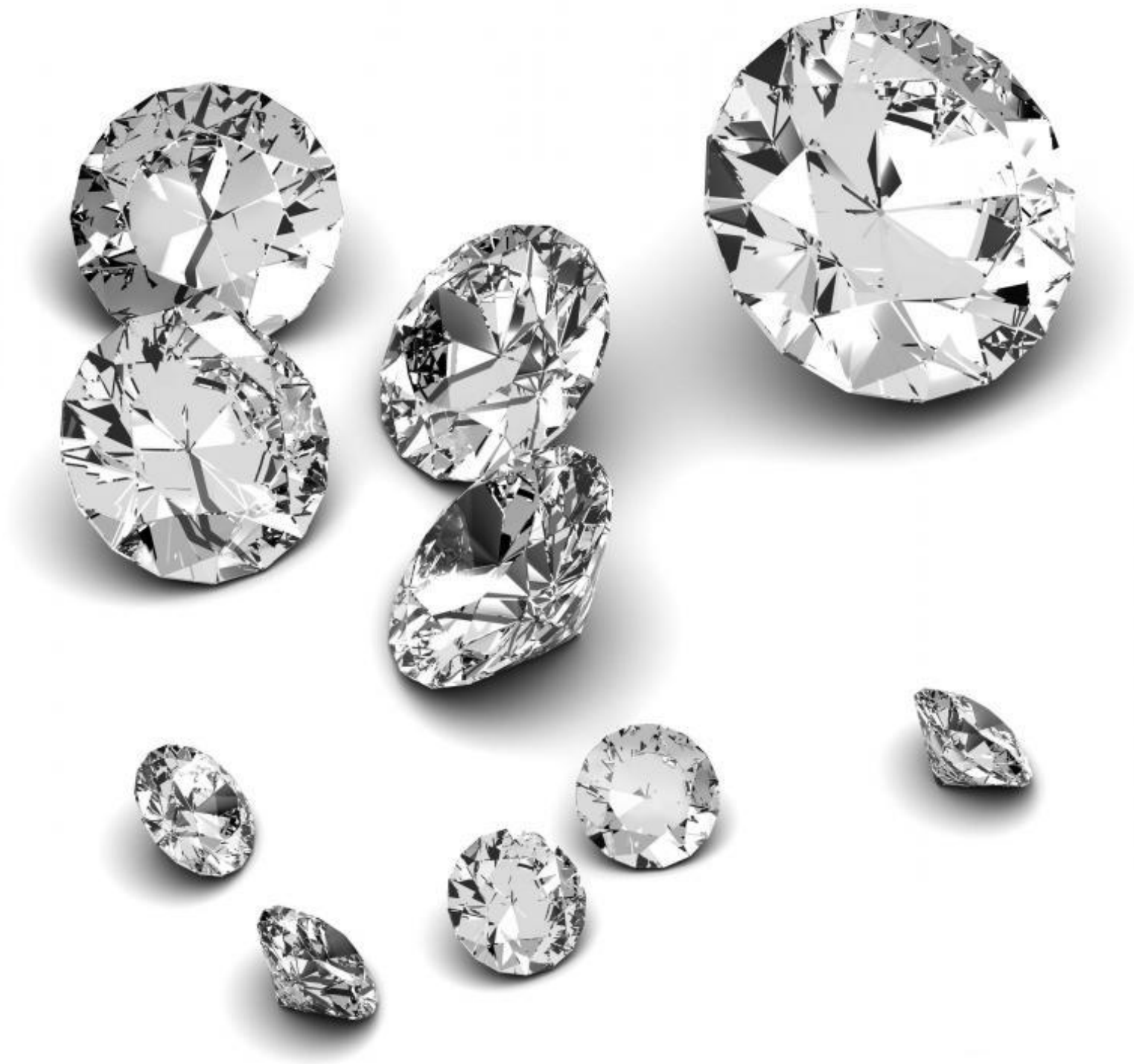
Image : diamonds