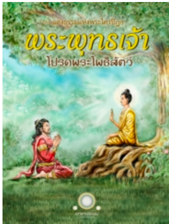
พระพุทธรเจ้าโปรดพระโพธิสัตว์