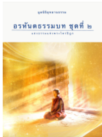
อรหันตธรรมบท ชุดที่ ๒