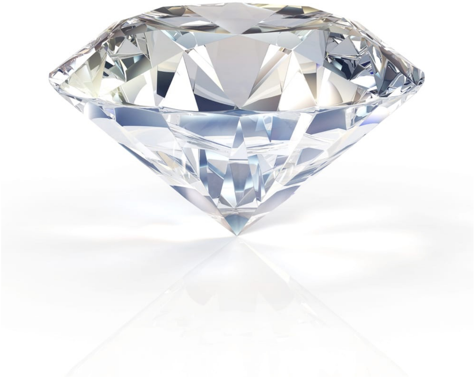
Image : diamonds